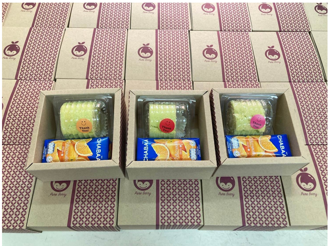
อาหารว่างพร้อมเครื่องดื่ม