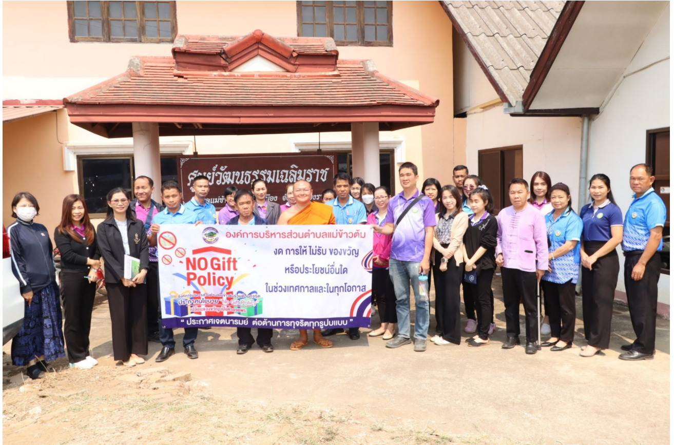
ประกาศนโยบาย No Gift Policy