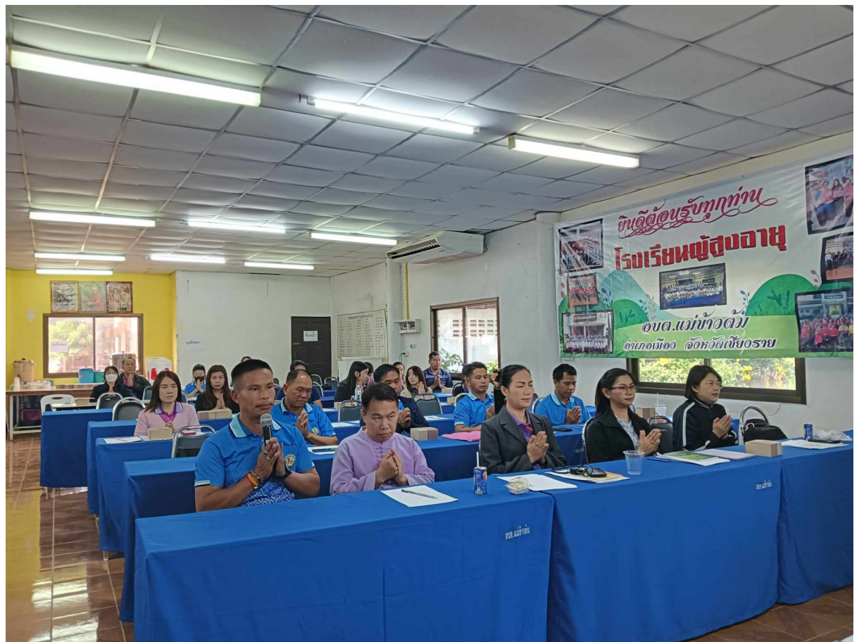
สวดมนต์ แผ่เมตตา ทำสมาธิ ฝึกจิตให้ว่าง