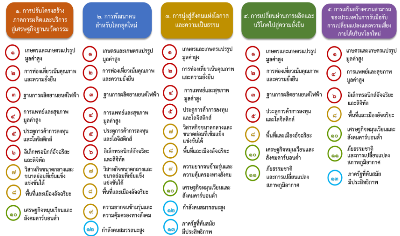
แผนภาพที่ ๑ ความเชื่อมโยงระหว่างหมุดหมายกับการพัฒนาเป้าหมายหลัก

ความเชื่อมโยงระหว่างหมุดหมายการพัฒนากับเป้าหมายหลักแสดงไว้ในแผนภาพที่ ๓.๑ โดยหมุดหมายการพัฒนาที่กำหนดขึ้นเป็นประเด็นที่มีลักษณะเชิงบูรณาการที่ครอบคลุมการพัฒนาตั้งแต่ในระดับต้นน้ำจนถึงปลายน้ำ และสามารถนำไปสู่ผลพัฒนาทั้งในมิติเศรษฐกิจ สังคม ทรัพยากรธรรมชาติและสิ่งแวดล้อมไปพร้อมๆ กัน ทำให้หมุดหมายแต่ละประการสามารถสนับสนุนเป้าหมายหลักได้มากกว่าหนึ่งข้อ นอกจากนี้การพัฒนาภายใต้แต่ละหมุดหมายไม่ได้แยกขาดจากกัน แต่มีการสนับสนุนหรือเอื้อประโยชน์ซึ่งกันและกัน